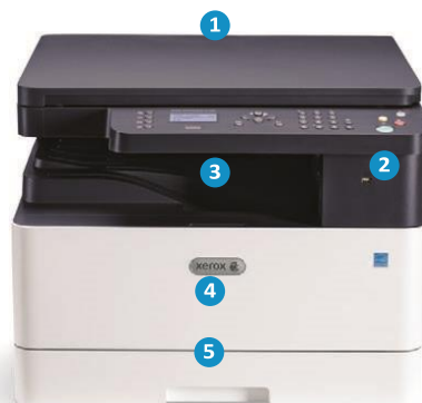
Многофункционално устройство Xerox® B1022

9 Xerox® B1025 притежава цветен сензорен интерфейс с диагонал 4,3 инча,