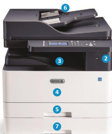
Многофункционално устройство Xerox B1025

Конфигурацията с DADF на снимката е с опционална допълнителна тава за хартия